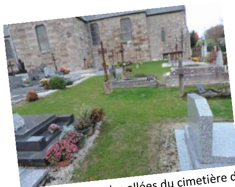
Engazonnement des allées du cimetière de Braffais, permettant une diminution de temps de travail pour l'agent communal et une diminution de l'utilisation des produits pesticides.