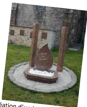
Création d'un jardin du souvenir dans le cimetière de Braffais