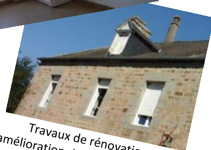
Travaux de rénovation et d'amélioration dans certains logements communaux de Plomb