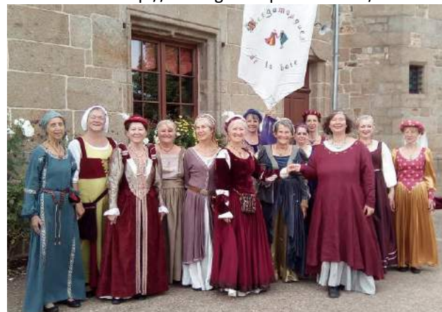
Journée du Patrimoine à St-Martin-de-Landelles

Site internet : http://lesbergamasques.wix.com/site