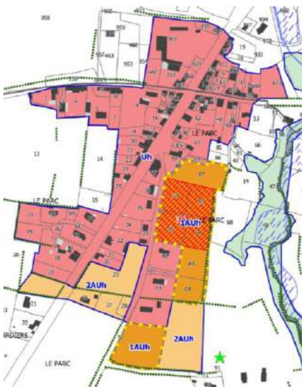
Secteur Le Parc

Sur la commune, cinq zones ont été définies comme étant urbanisées (zone Uh) et à urbaniser (1AUh et 2AUh). Dans ces zones, peuvent être construites de nouvelles habitations (la zone 1AUh devra être en grande partie urbanisée avant de pouvoir construire dans la zone 2AUh). En dehors de ces zones, les nouvelles constructions d'habitation seront refusées hormis pour l'agrandissement et la rénovation d'une habitation existante et selon les cas, le changement de destination de certains bâtiments en habitation.