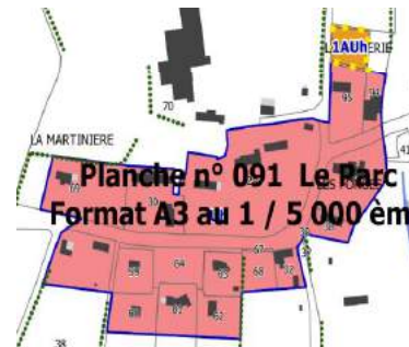
Secteur Braffais ancien bourg