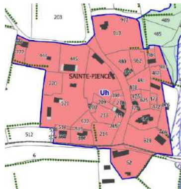
Secteur Ste-Pièce ancien bourg