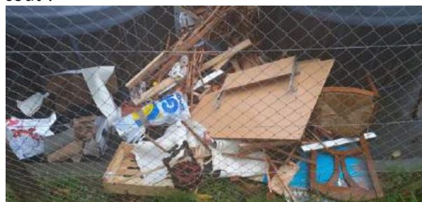
05 octobre 2020 – point d'apport route du Manoir - Plomb

Le Conseil Municipal devra se pencher sur le problème pour tenter d'y remédier, mais à quel coût ?