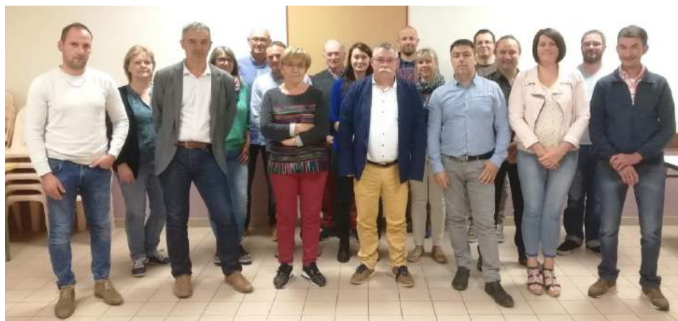
Absent sur la photo : Julien Lepesant